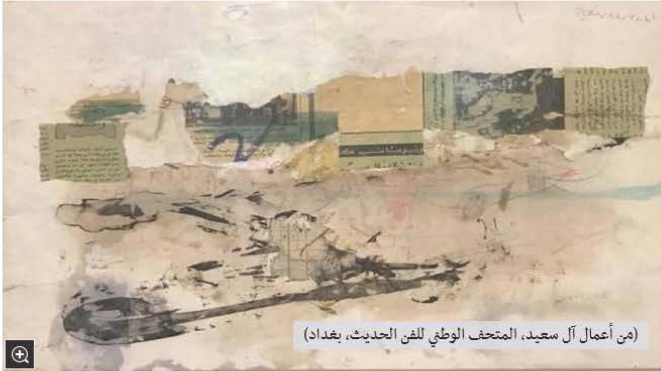
(من أعمال آل سعيد، المتحف الوطني للفن الحديث، بغداد)