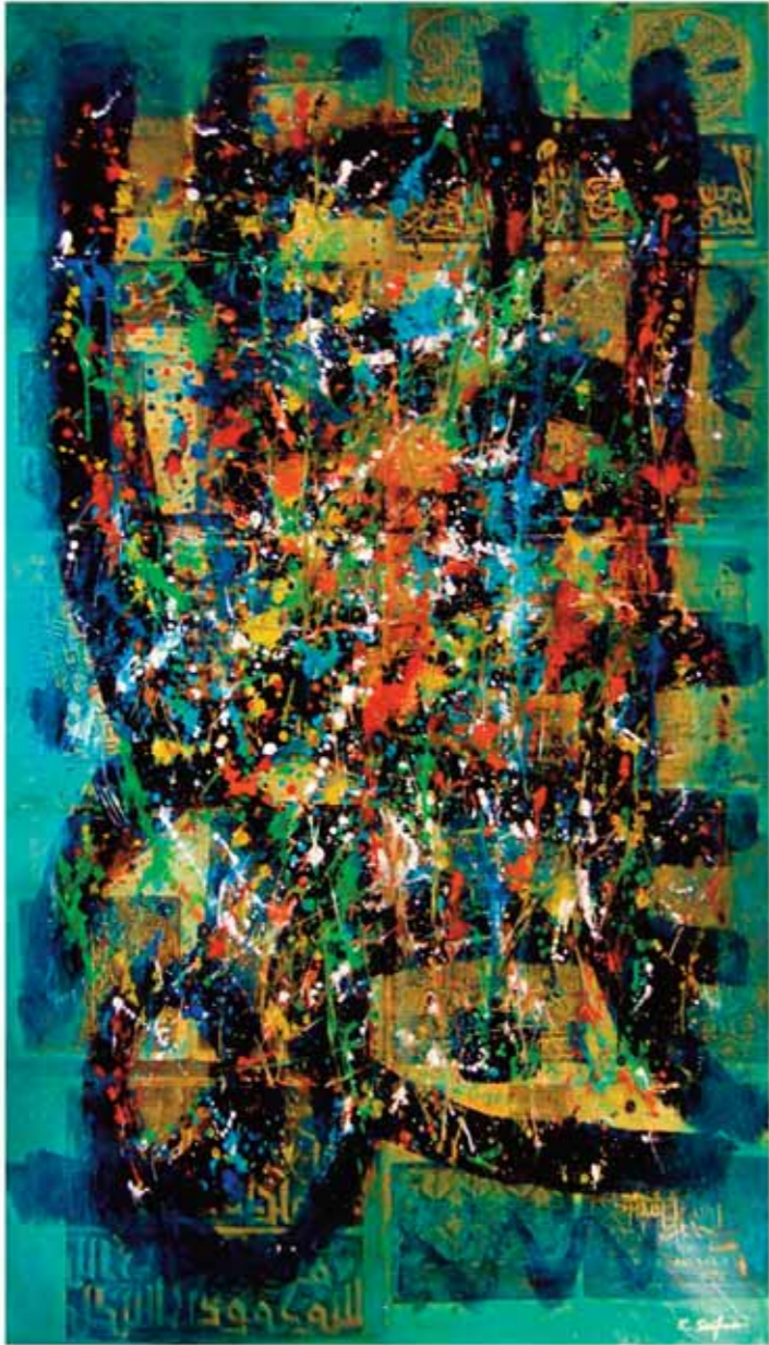
أكريليك وكولاج على قماش ٩٧ x ١٦٢ سم

Acrilique & collage sur canevas 162 x 97 cm