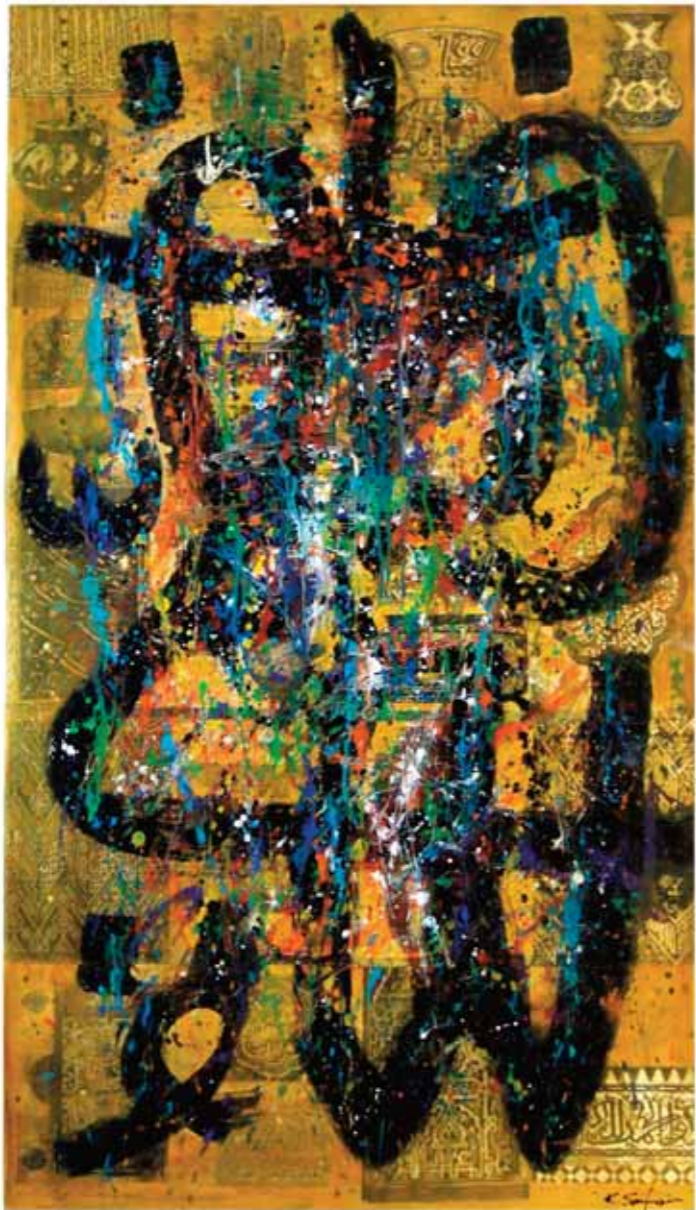
أكريليك وكولاج على قماش ٩٧ x ١٦٢ سم

Acrilique & collage sur canevas 162 x 97 cm