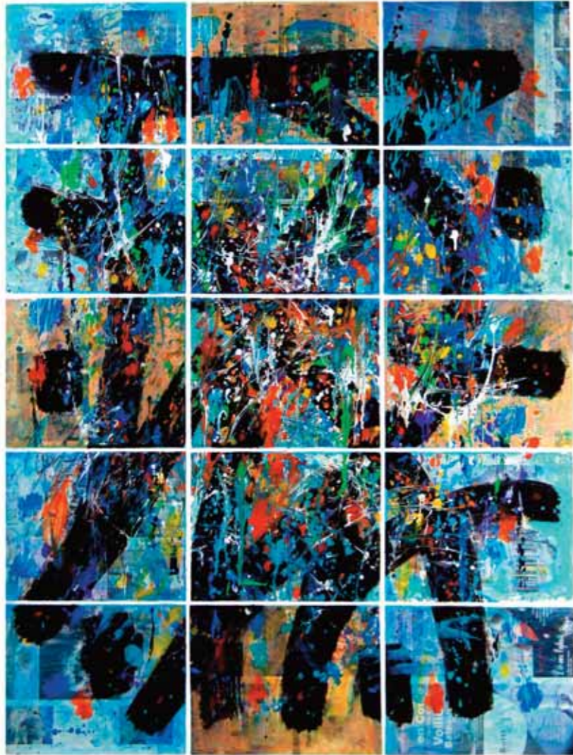
أكريليك وكولاج على خشب ١١٦ x ٨٩ سم

Acrilique & collage sur panneau 116 x 89 cm