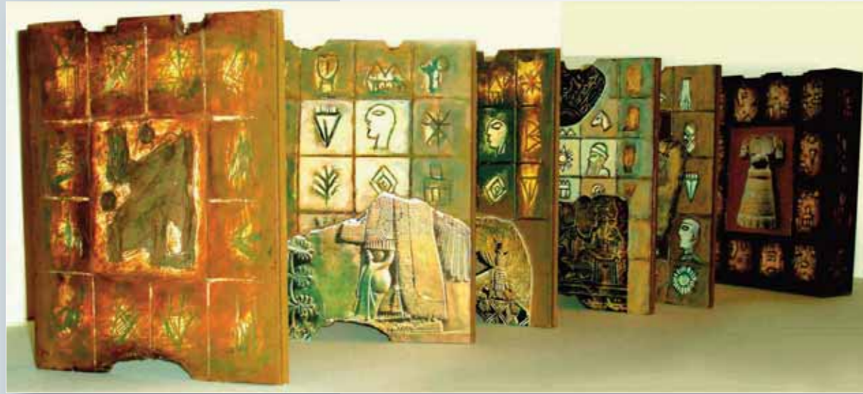
كتاب فنان أكريليك وكولاج على كرتون ٢٠ صفحة، ٢٤ x ٢٥٠ x ٦,٥ سم

Livre d'artiste Acrylique et collage sur carton 20 pages, 34 x 250 x 6,5 cm