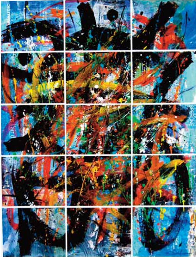
أكريليك وكولاج على خشب ٨٩ x ١١٦ سم

Acrilique & collage sur panneau 116 x 89 cm