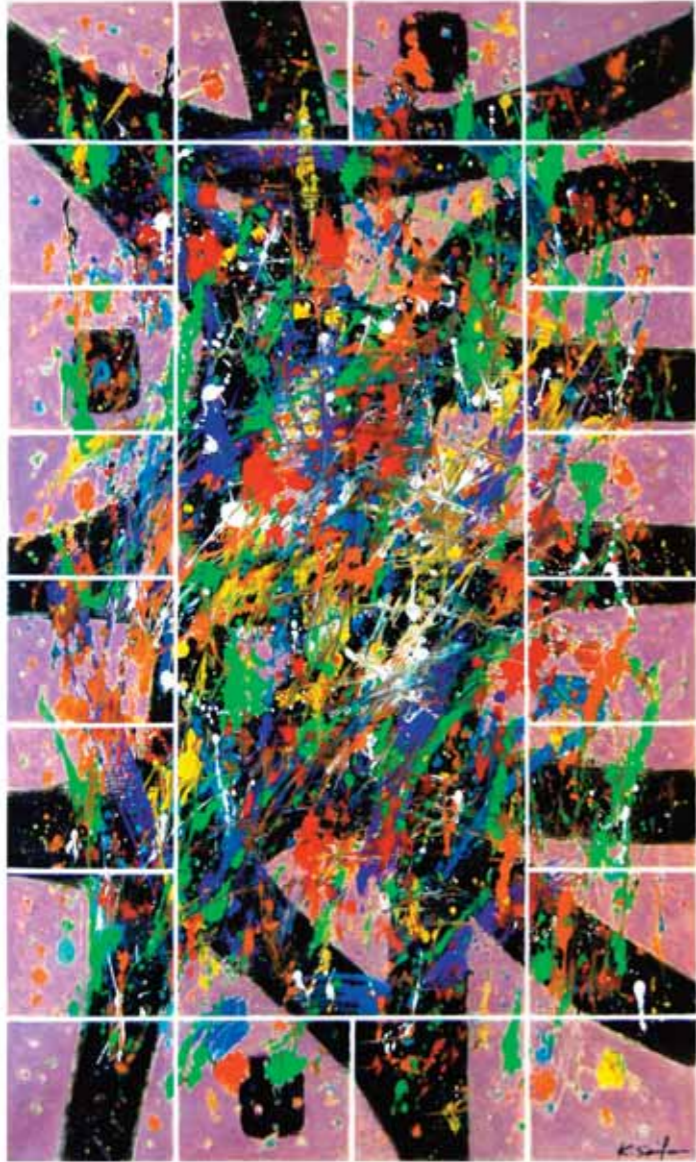
أكريليك وكولاج على قماش ٧٣ x ١١٦ سم

Acrilique & collage sur canevas 116 x 73 cm