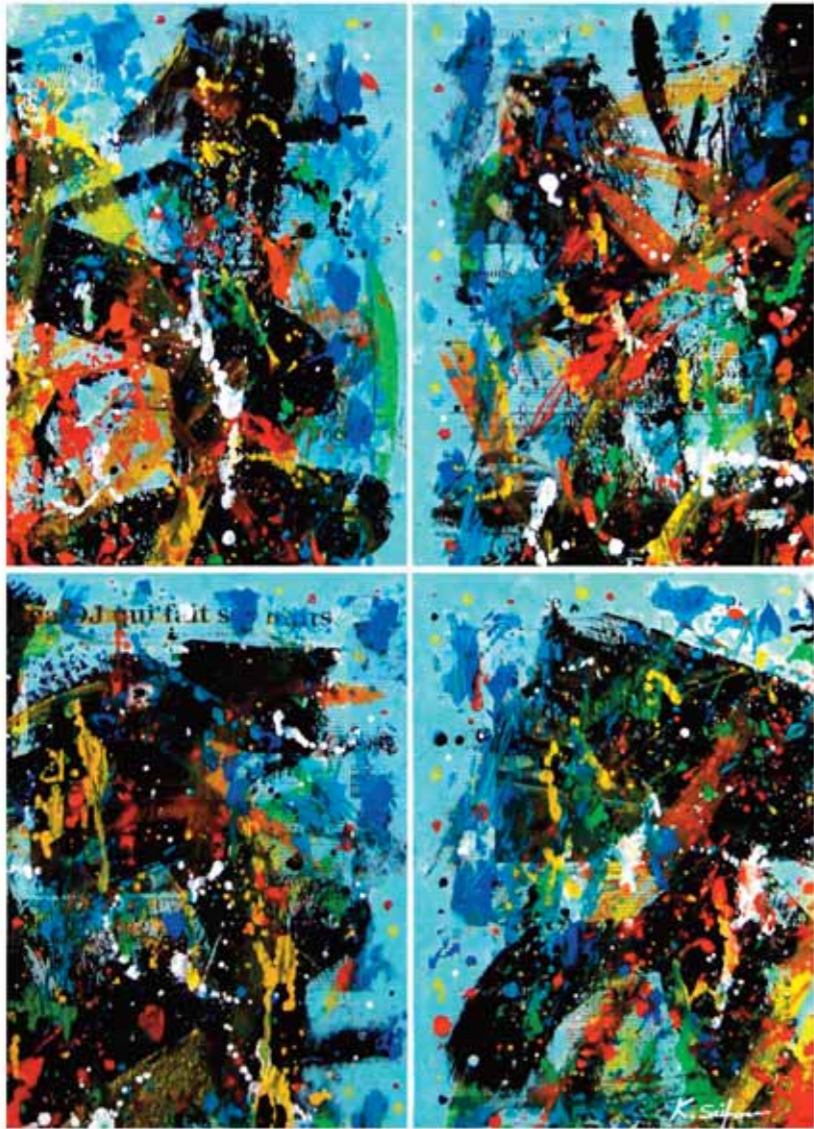
أكريليك وكولاج على قماش ١٠٠ x ٧٣ سم

Acrilique & collage sur canevas 100 x 73 cm