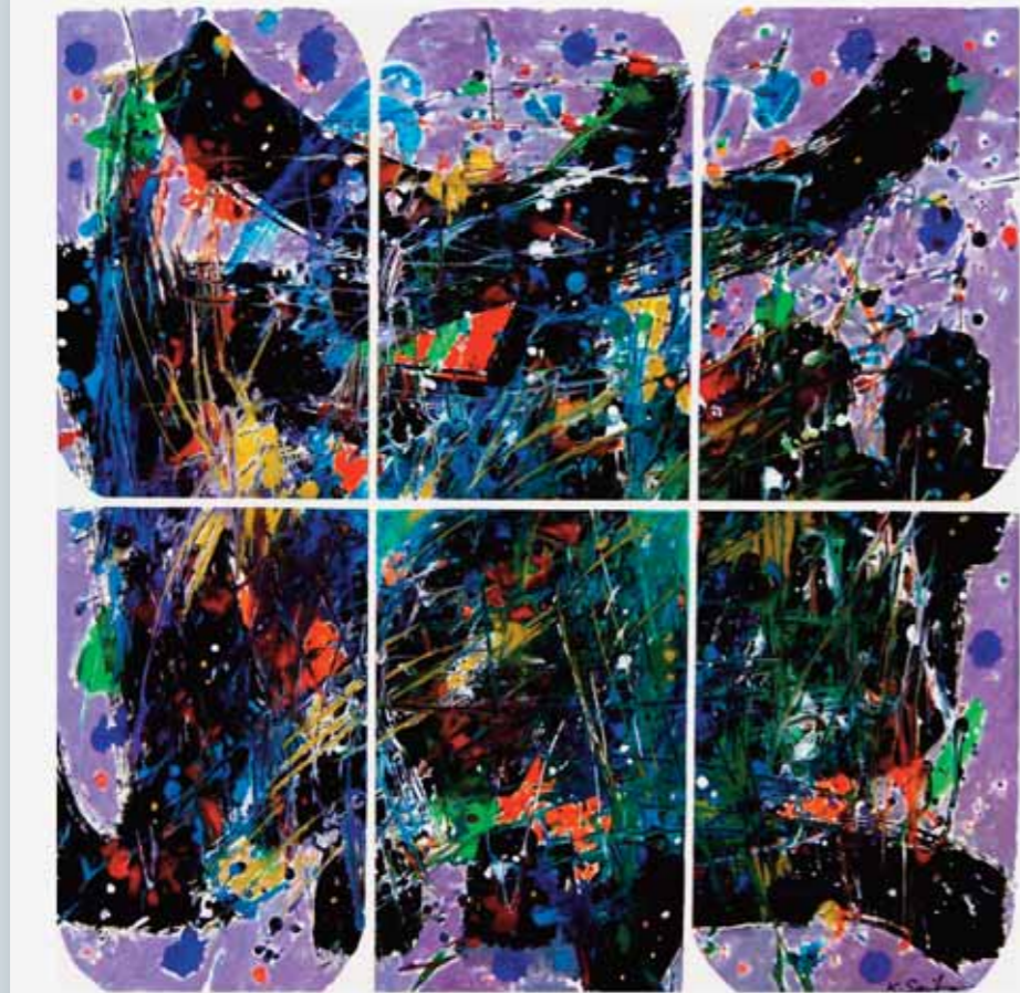
أكريليك على كارتون ٥٠ x ٥٠ سم