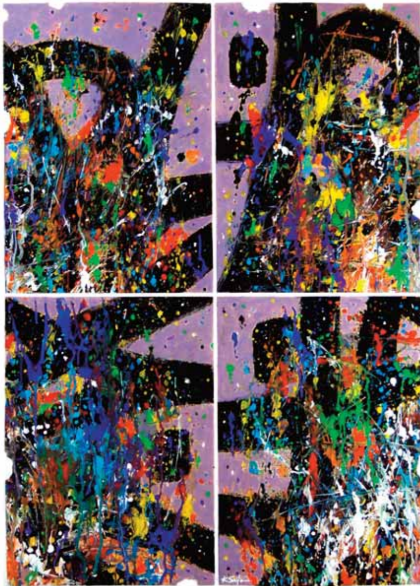
أكريليك وكولاج على قماش ٧٣ x ١٠٠ سم

Acrilique & collage sur canevas 100 x 73 cm