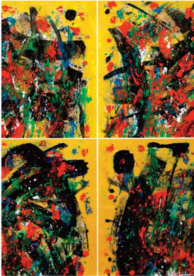
أكريليك وكولاج على قماش ١٠٠ x ٧٣ سم

Acrilique & collage sur canevas 100 x 73 cm