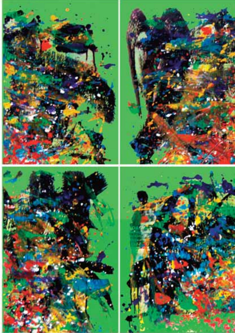
أكريليك وكولاج على قماش 100 x 73 سم

Acrilique & collage sur canevas 100 x 73 cm