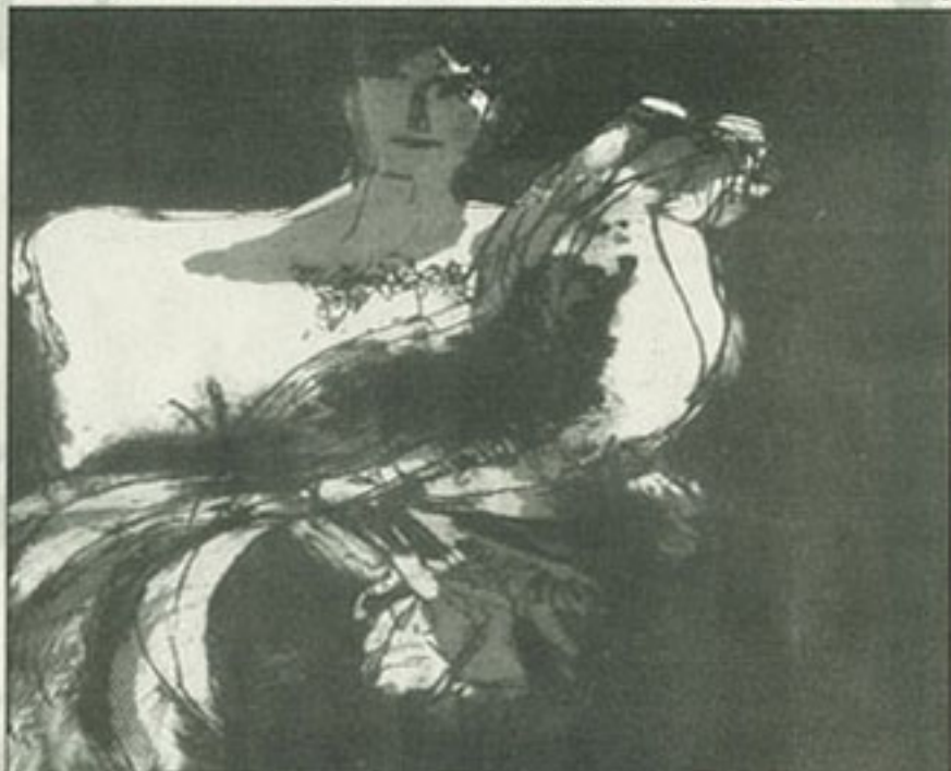
● من أعمال إسماعيل فتاح